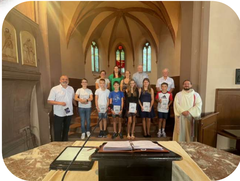
Rentrée du Cathéchisme 17 septembre 2023