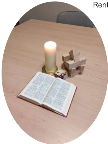
Groupe de prière qui se retrouve une fois par parution du nouveau messager à 19h