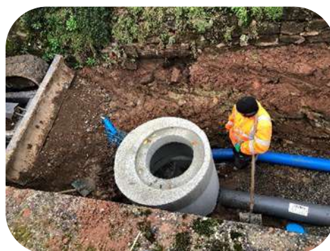
Rue du Presbytère : rénovation réseaux