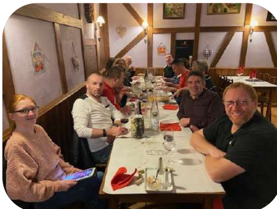
Repas annuel de l'ASK, Samedi 18 Novembre 2023