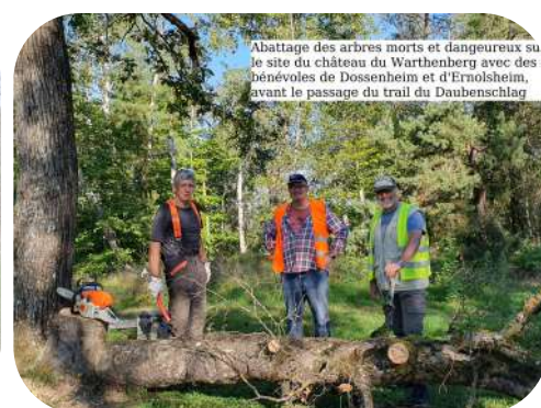
Abattage des arbres morts et dangereux sur le site du château du Warthenberg avec des bénévoles de Dossenheim et d'Ernolsheim, avant le passage du trail du Daubenschlag