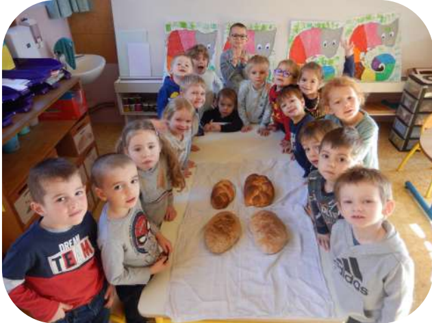
Confection de pains et brioches

Découverte de la caserne des pompiers de Saverne le 20 mars 2023