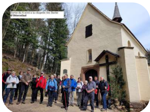
Sortie du 6 avril à la chapelle Ste Barbe d'Ottenshal