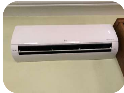
Remplacement du chauffage à la maison de la culture