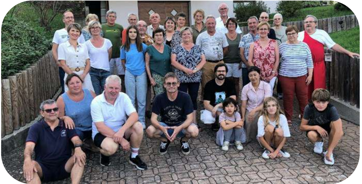
Les voisins des rues St-Jean et St-Michel

Pour cette 24ème édition, les voisins de la Rue St-Jean ont invité ceux de la Rue Saint-Michel.