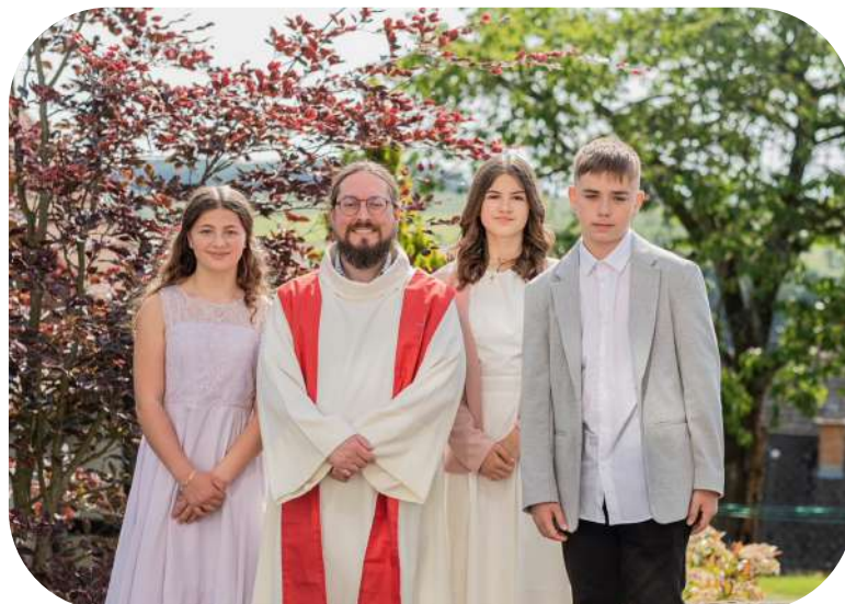
Confirmation 28 mai