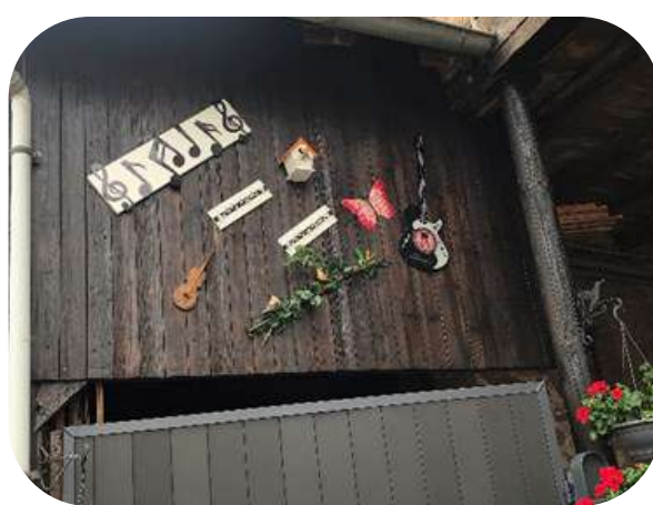
Quelques réalisations de concitoyens