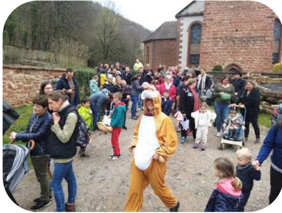
Chasse aux oeufs, samedi 8 Avril 2023