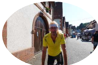
Les conseillers municipaux sur la piste cyclable