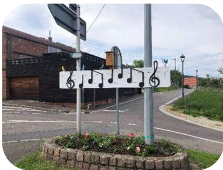
Le nouveau thème