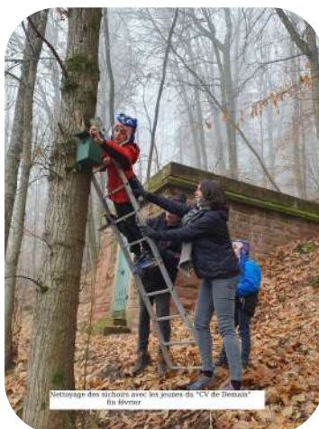
Nettoyage des arbres avec les jeunes du "CV de Demain" fin février