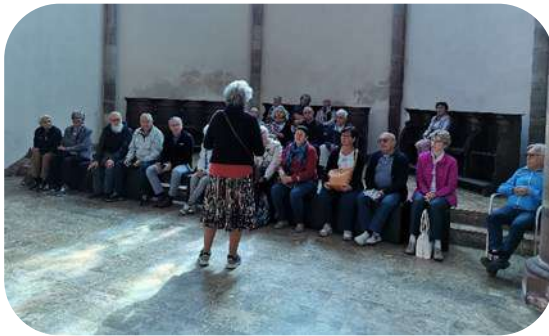
Le 25 mai : découverte du Parcours Marc Chagall à Sarrebourg