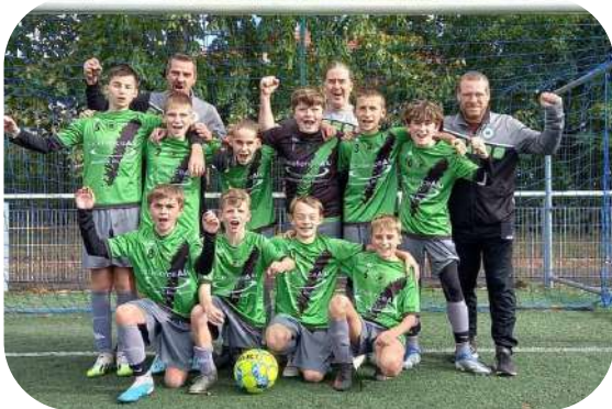
La joie des victoires