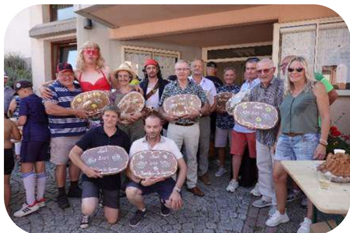
Le verre de l'amitié et le traditionnel pain d'épice