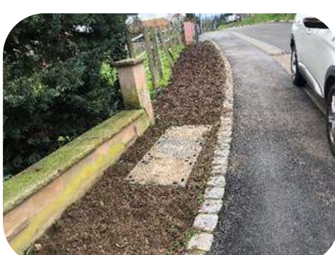
Aménagement Rue des Vergers