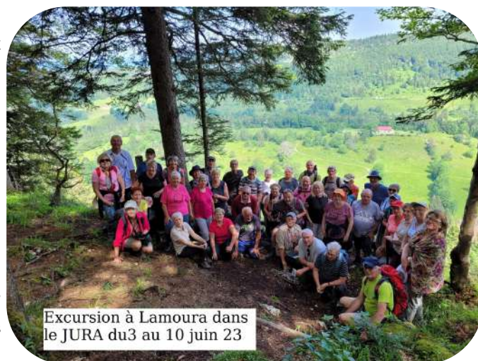
Excursion à Lamoura dans le JURA du 3 au 10 juin 23

d'autres choses pour une adhésion réduite à 5 €/an. Pour financer ces activités, un stand de vin chaud et articles de Noël confectionnés par les enfants et les encadrants, sont proposés tous les ans sur le marché de la St Nicolas à Steinbourg