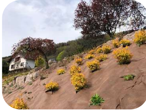
Aménagement du talus