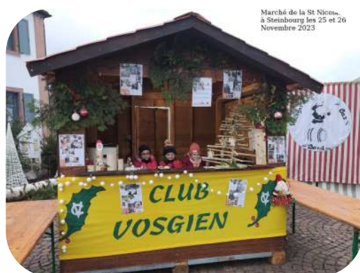
Marché de la St Nicolas à Steinbourg les 25 et 26 Novembre 2023