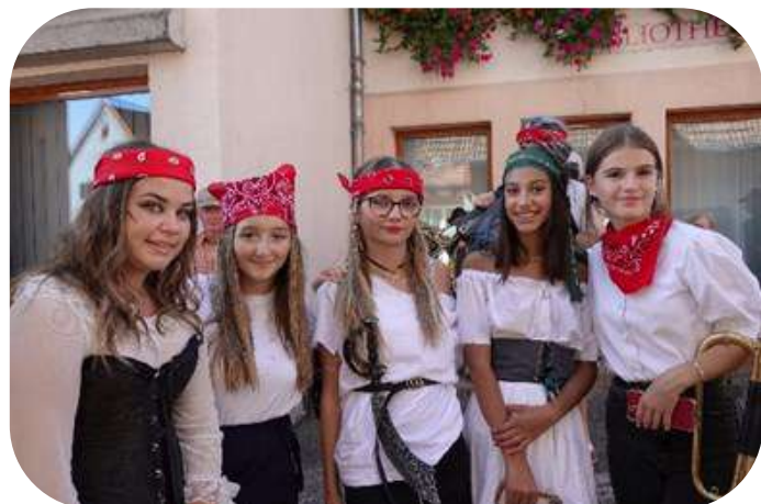
Les jeunes étaient de la partie