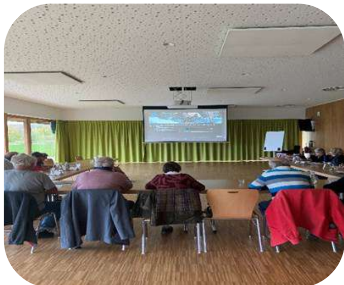
Les Ateliers smartphone de septembre à décembre 2023