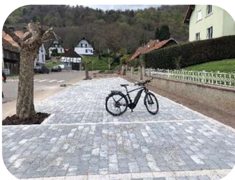
Aménagement aire de stationnement