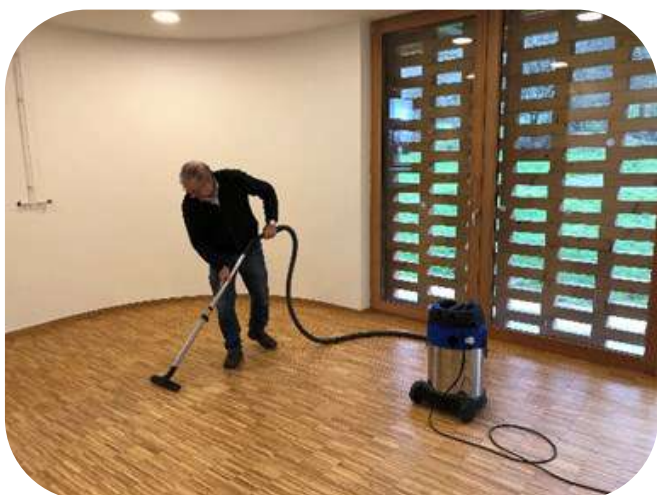
Nettoyage de la salle