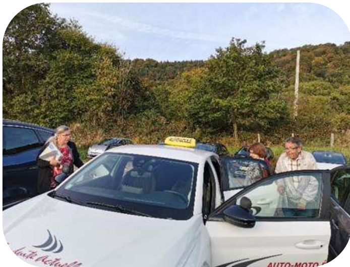
Les ateliers conduite automobile seniors

« Mieux vivre à Ernolsheim et environs » : actions menées par la Commune d'Ernolsheim et l'UNIAT avec le soutien financier de la Conférence des Financiers