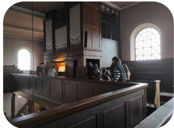
Découverte de l'orgue pour les confirmands