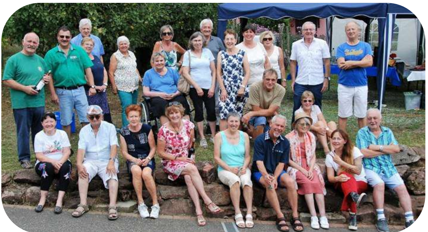
Les voisins des rues de la Zinsel et de Dossenheim

Les voisins de la Rue de la Zinsel et la Rue de Dossenheim, après trois années blanches liées à la pandémie, ont reconduit la rencontre au bonheur de tous..