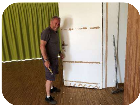
Inversion de l'ouverture des portes

(Quelques exemples d'occupation de la salle)