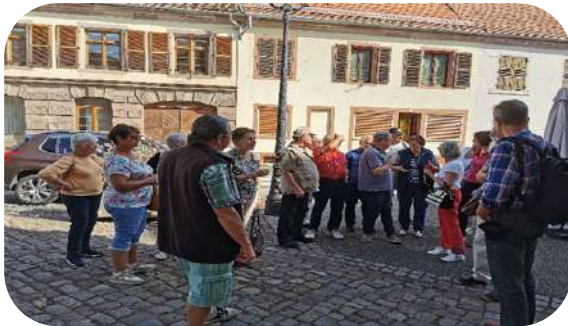
Et aussi le Musée du Patrimoine et du Judaïsme de Marmoutier