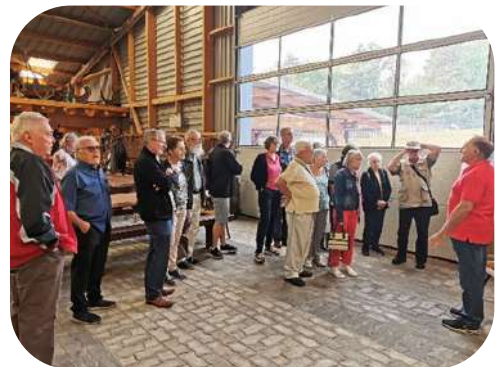
Le 28 septembre : visite au Musée du Patrimoine Agricole à Allenwiller