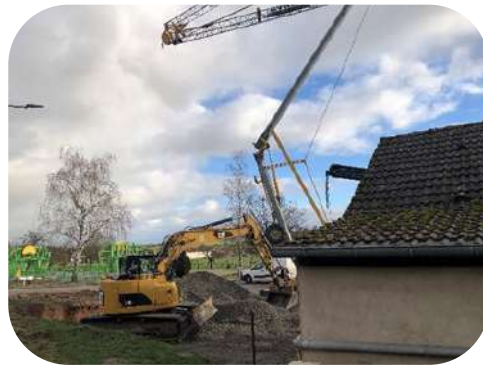
Démarrage du chantier « Rénovation-Extension des vestiaires »