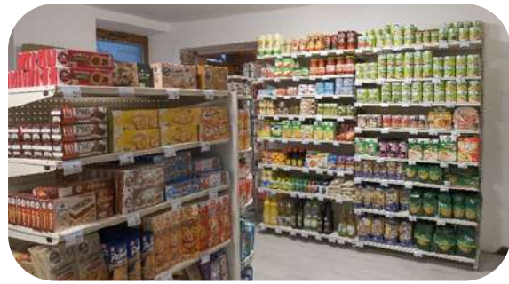
Aménagement local pour le magasin PROXI