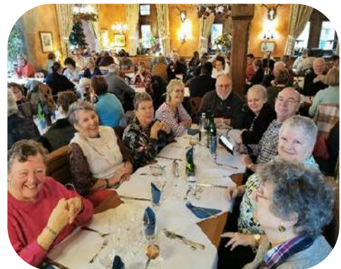
Le 30 novembre : pour bien finir l'année, Visite du Marché de Noël d'Obernai avec nos amis Reliance Saverne