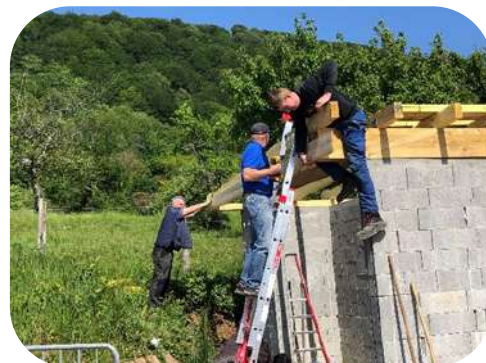
Local « poubelles » salle festive