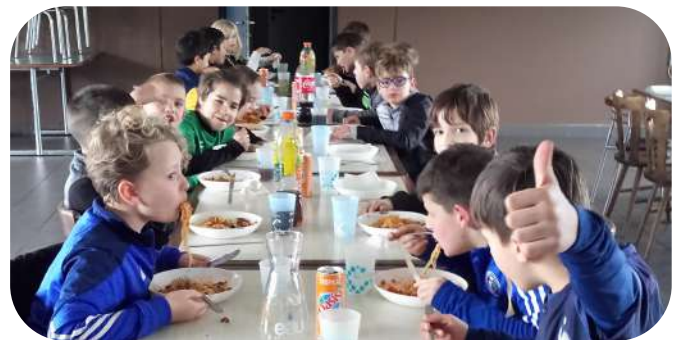
Un stage de football au mois d'avril