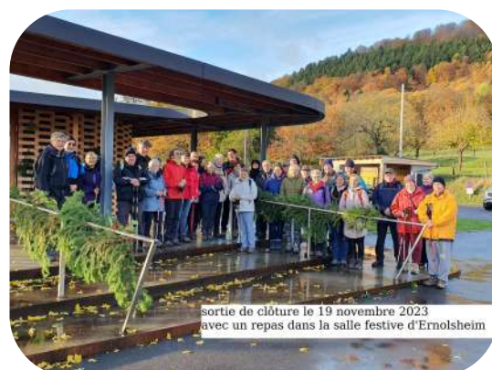
sortie de clôture le 19 novembre 2023 avec un repas dans la salle festive d'Ernolsheim

Un grand merci à tous les bénévoles qui ont permis cette année encore à financer les futures activités de cette équipe.